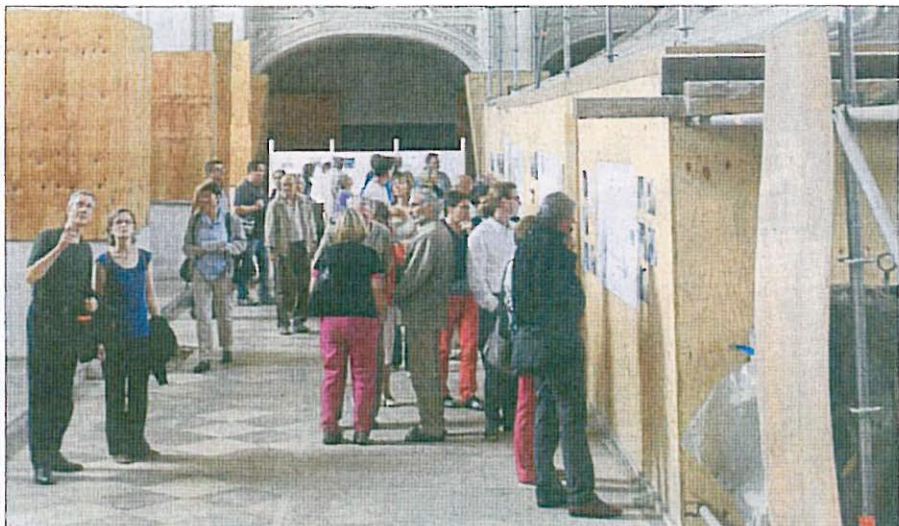
Die Jesuitenkirche St. Ignatius in der Neustadt ist das Ziel von Tausenden Besuchern geworden.